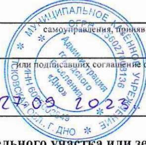
Схема расположения земельного участка или земельных участков на кадастровом плане территории